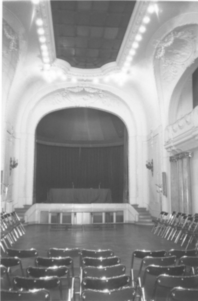
Salle des Propriétaires boulevard Saint-Germain

Car de même que la force musculaire est nécessaire à l'action physique, des forces spirituelles devraient se lier avec nos propres forces pour que nous puissions agir dans le spirituel. Et si nous y sommes préparés, nous pouvons sentir comment « les forces des morts (...) agissent en nous ».