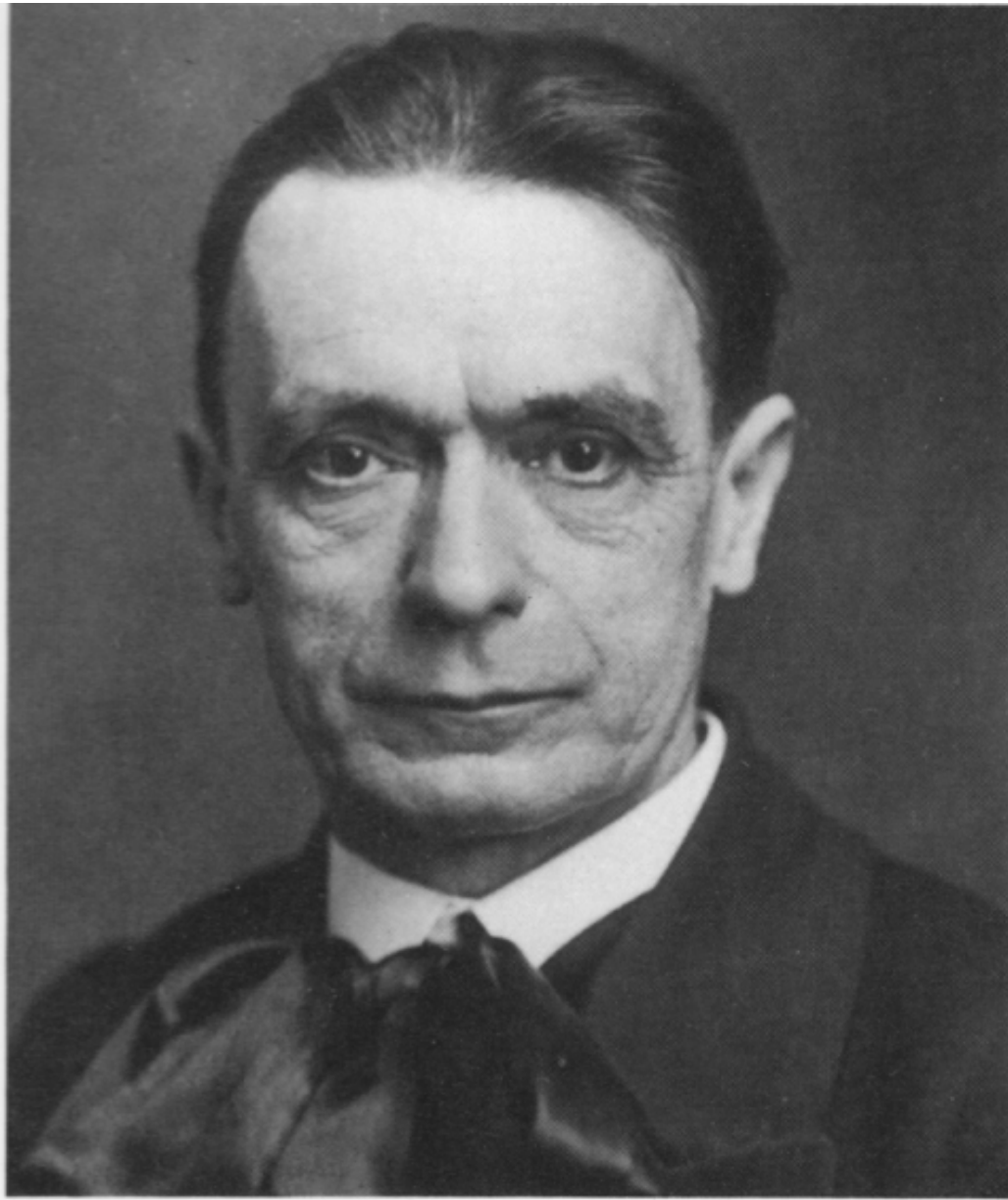
Rudolf Steiner en 1920